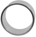
Collarín SL R